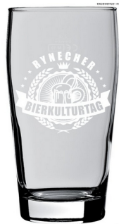
Das unverkennbare BierKulturGlas

OK RBKT, Brauhaus 531 Bäch, BrauGarage Reinach